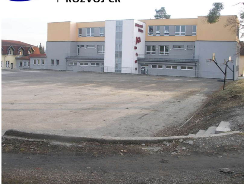
parcels č. 37/1_pohled na stávající hrací plochu a pavilon 2 ZŠ Šenov, únor 2019