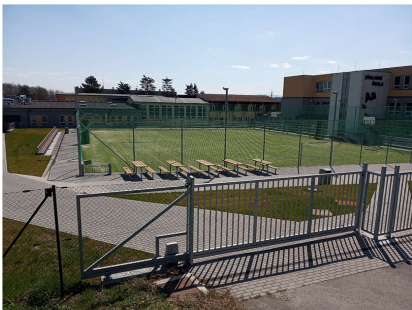
vstup na sportoviště od ul. Školní, pohled na pojezdovou bránu (součást SO 07), SO 01 Multifunkční hřiště, SO 06 Vnitroareálové oplocení, SO 09 Umělé osvětlení hracích ploch, SO 08 Tribuna, SO 04 Komunikační a manipulační plochy; duben 2021