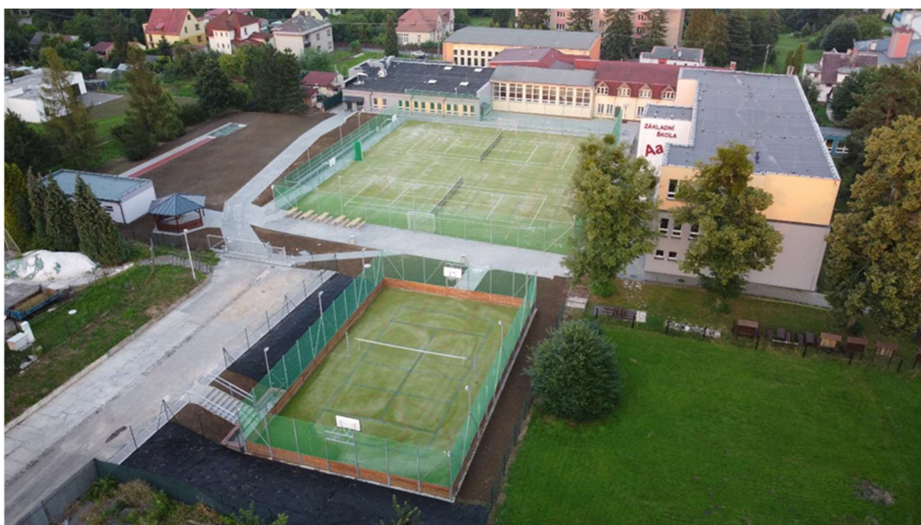
pohled na dokončený areál stavby „Venkovní sportoviště ZŠ Střed v Šenově“ umístěný na parcelách č. 37/1, 36/2 a 3309/2 v k. ú Šenov u Ostravy; srpen 2020